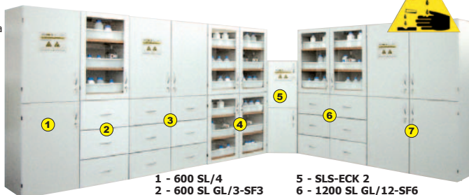
1 - 600 SL/4 2 - 600 SL GL/3-SF3 3 - 1200 SL/12-SF6 4 - 1200 SL GL/12