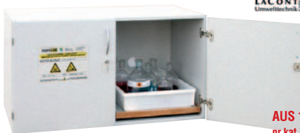
AUS 1100 SL nr kat. 0702-00203